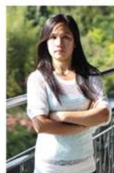
Divine Power Speakingヘッドティーチャー

JICに勤務して4年目になります。超初級者を受け持つキャンパスのヘッドティーチャーとして常に、講師への正当な評価と弱点の把握、育成を徹底しています。あなたの人生の1ページにJICでの留学を加えてみて下さい。後悔はさせません。きっと見違えるほど変わった自分に会えるはずですよ。